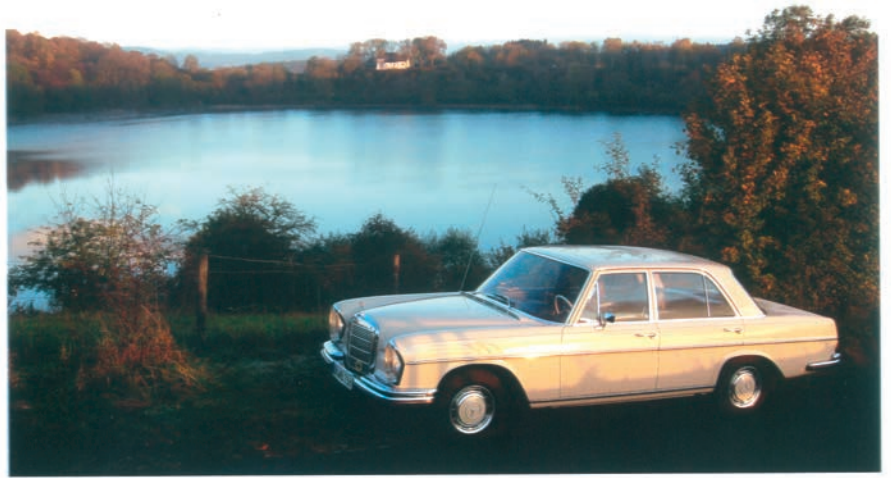
Das Weinfelder Maar bei Sonnenaufgang