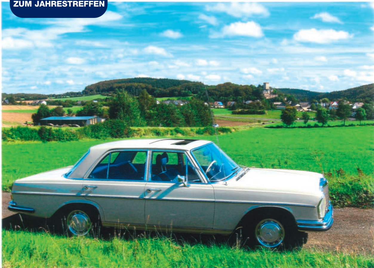
Burg Kerpen grüßt von weitem