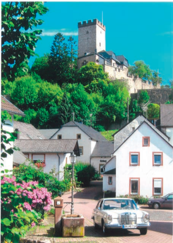
Die weiße Dame zu Füßen der Burg

Zwischen Rhein, Maas und Mosel, im Dreieck der Städte Aachen, Koblenz und Trier, liegt das Berg- und Waldland der Eifel. Bevor die Eifel ihre heutige Gestalt erhielt, mussten lange Epochen der Erdgeschichte mit gewaltigen Eruptionen vergehen. Feuer speiende Vulkane brachen immer wieder aus der Tiefe der Erde hervor und begruben das Land unter einer dicken, schwarzen Lavaschicht. Zurück blieben die Maare, mit Wasser gefüllte Krateröffnungen, die wie dunkle Augen in der weiten Landschaft liegen. In diese faszinierende Landschaft möchte ich Sie, liebe Leser, gerne mitnehmen. Steigen Sie ein und begleiten Sie mich auf meiner Fahrt „Mit der weißen Dame in die Vulkaneifel“.