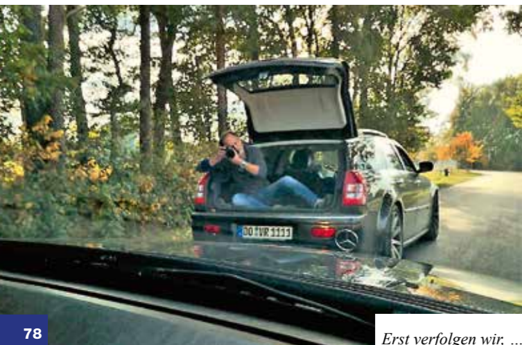
Erst verfolgen wir, ...