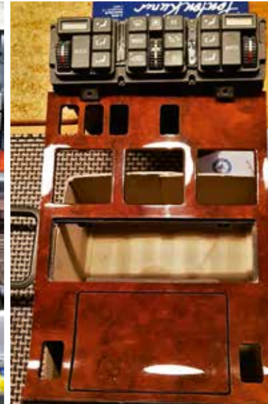
Bei der Gelegenheit wurden auch die Holzintarsien aufbereitet.