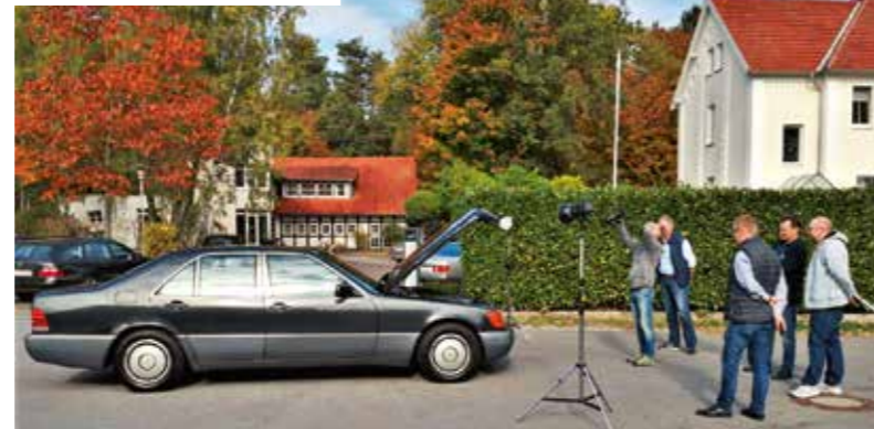
Auf der Suche nach dem perfekten Licht