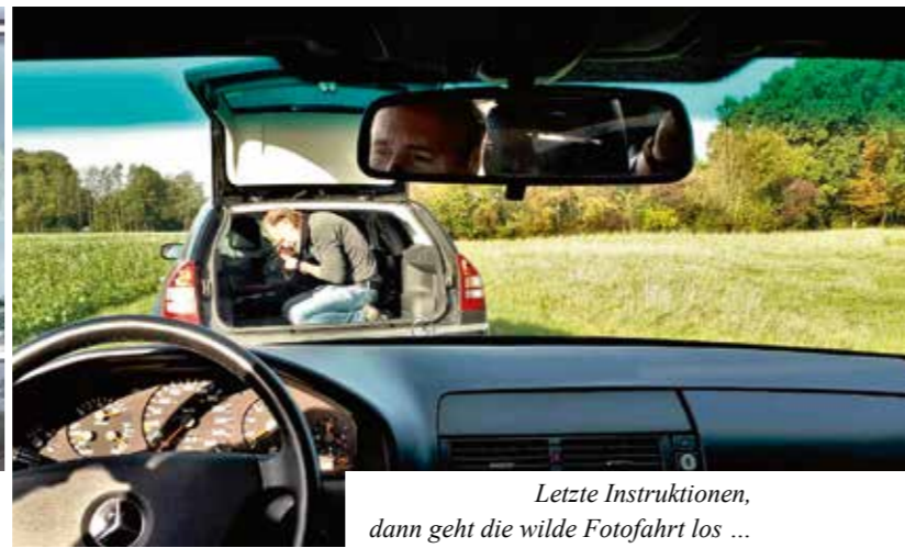
Letzte Instruktionen, dann geht die wilde Fotofahrt los ...