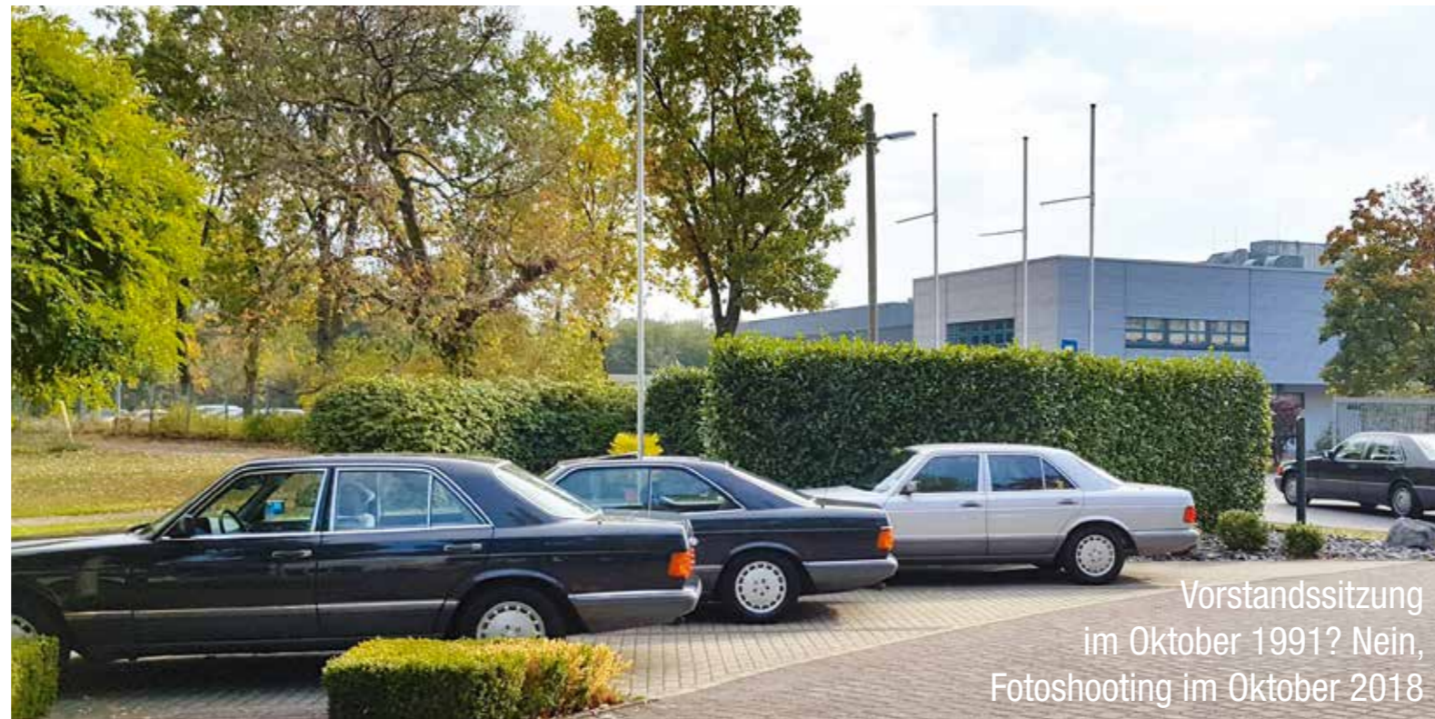
Vorstandssitzung im Oktober 1991? Nein, Fotoshooting im Oktober 2018

Bei unserem sehr frühen Modell sind die Birnen nicht von oben, sondern noch von unten gesteckt. Hierfür muss allerdings die Wurzelholzleiste mit den vier Stellrädchen selbst ausgebaut werden. War die ganze Mühe jetzt etwa umsonst? Nicht ganz. Wo ich schon mal alles zerlegt hatte, konnte ich so die beiden ausgehakten Bowdenzüge der Lüftungskappen wieder einhängen und auch die Kalt/Warm-Tasten durch Einbau eines neuen Birnchens wieder nett hinterleuchten. Nachdem ich Stunden später in der Mittelkonsole alles korrekt zum Leuchten gebracht und auch wieder zusammengebaut hatte, nahm ich mir danach noch die Beleuchtung der Symbolleiste des Lichtdreh Schalters vor. Ein Kinderspiel im Vergleich zu den vier Lüftungsrädchen. Diese – ich gebe zu, manchmal doch nervenaufreibende – Friemelarbeit sorgt zwar nicht für ein besseres Fahrverhalten. Aber ich mag es einfach, wenn die Lämpchen, die ab Werk verbaut sind, alle korrekt ihren Dienst tun! So machen jetzt auch die Dunkelfahrten wieder richtig Spaß.