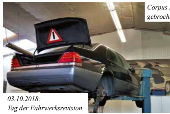
03.10.2018: Tag der Fahrwerksrevision