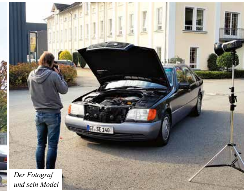
Der Fotograf und sein Model