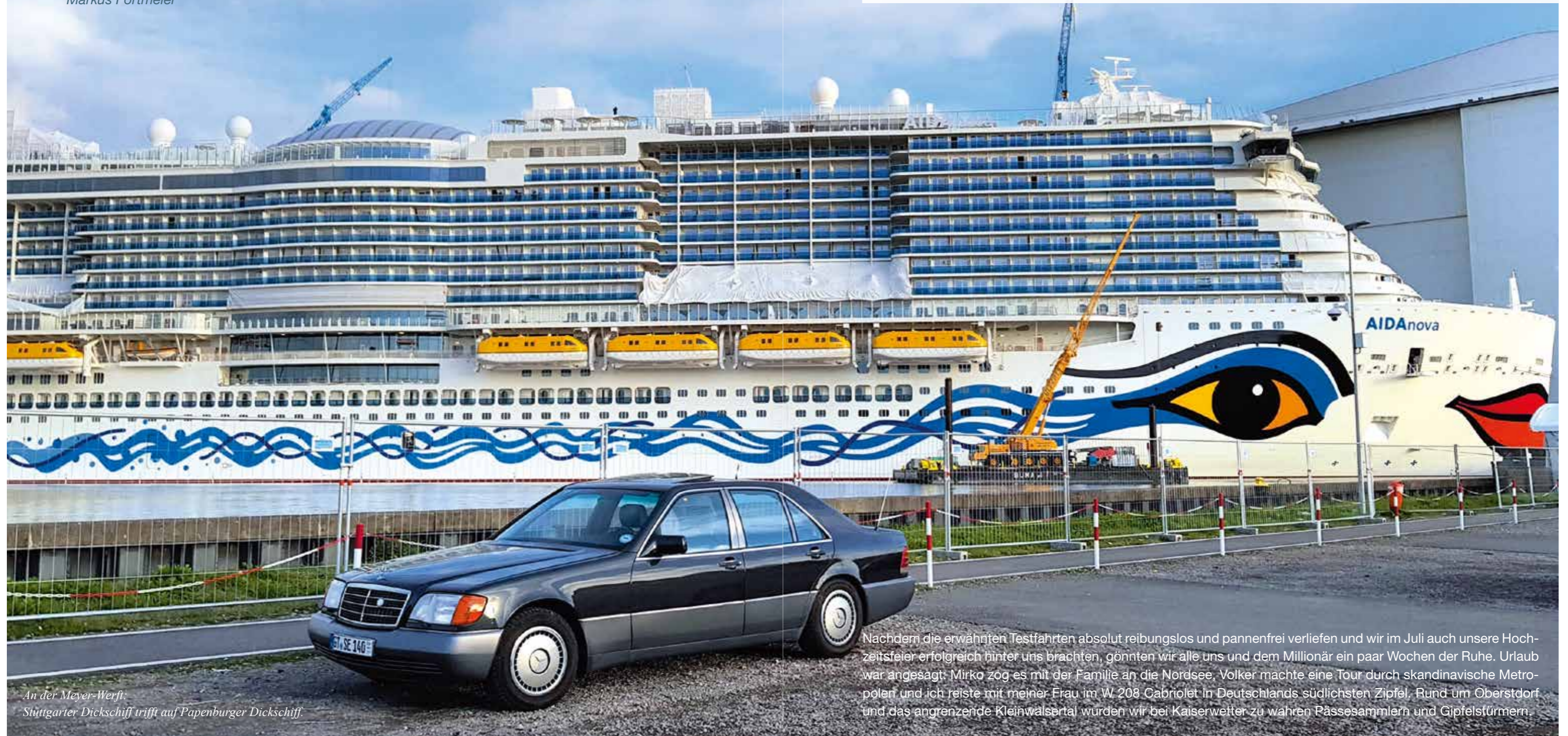
An der Meyer-Werft. Stuttgarter Dickschiff trifft auf Papenburger Dickschiff.

Was war das doch für eine ereignisreiche, spannende und intensive erste Jahreshälfte 2018. Alles begann im März mit der Entdeckung unseres Kilometer-Dauerläufers bei mobile.de. Es folgten die spontane Besichtigung und der eigentlich gar nicht geplante Kauf des W 140. Bei der anschließenden „Express-Restaurierung“ gelang es uns, innerhalb von nur acht Wochen ein auf den ersten Blick wenig gepflegtes Ge- oder besser gesagt VERbrauchtfahrzeug wieder in eine vorzeigbare Oberklasse-Limousine zu verwandeln. Komplett in Eigenleistung, versteht sich. Bei seinen ersten Ausfahrten zum Jahrestreffen nach Celle, von dort aus nach Papenburg, zum Oldtimermarkt nach Bockhorn und zur Ahnenforschung in seine alte Heimat Bremen erhielt unser 300 SE nicht nur seinen heute nicht mehr wegzudenkenden Spitznamen „der Millionär“. Nein, hierbei konnte er auch gleich seine Nehmerqualitäten unter Beweis stellen. Schließlich muss er für unser Langzeitprojekt, die 1 000 000 Kilometer zu knacken, in Zukunft noch rund 40 000 Kilometer abspulen.