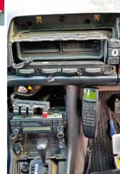
Sisyphusarbeit: Zerlegung der Mittelkonsole, um defekte Birnchen auszutauschen.

Was gab es für die anstehende Fotostory noch zu tun? Nach dem abermaligen Polieren des Lackes und Mirkos penibler Zahnbürsten-Innenraumreinigung ging ich eine Sache an, die mich bei jeder Fahrt mit dem Millionär störte: den Austausch der vielen defekten Lämpchen in der Mittelkonsole.