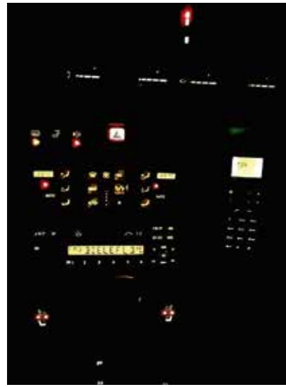
Jetzt leuchtet alles wieder so, wie es soll.

Mitteldusche ausgebaut hatte, war danach die Enttäuschung umso größer. Die in dem Video gezeigten, von oben eingesetzten Steckbirnen waren bei unserem Auto einfach nicht zu finden! Nach Recherche im Netz brachte ich später in Erfahrung, dass es 1994 mit Einführung der Modellpflege wohl geändert wurde.