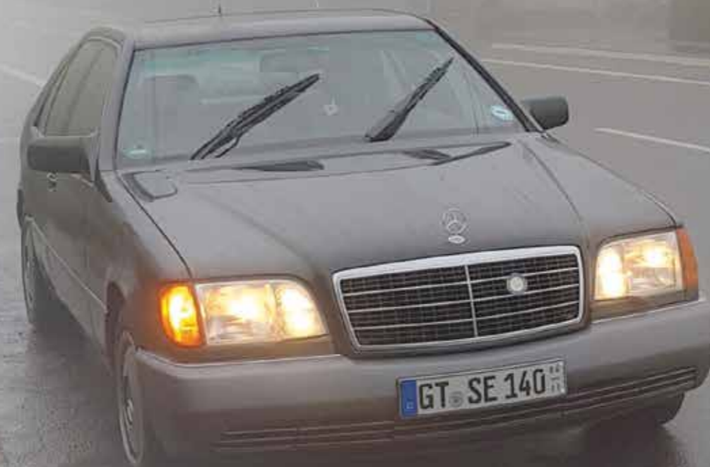
Trotz mittlerweile passablem Zustand alles andere als ein Schönwetter-Auto: Ende November irgendwo im Westerwald auf dem Weg zum Fürstentreffen