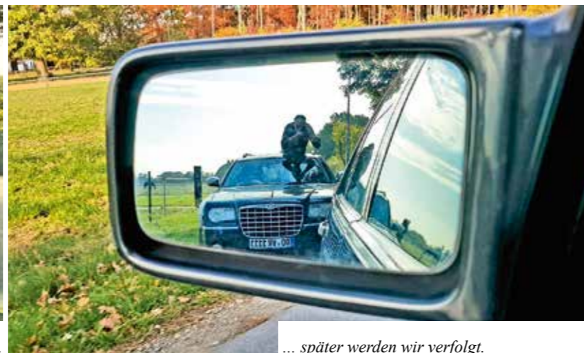
... später werden wir verfolgt.